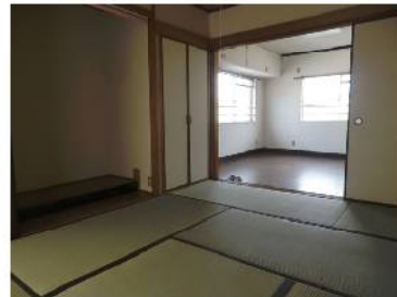
洋室と和室で広々使えます