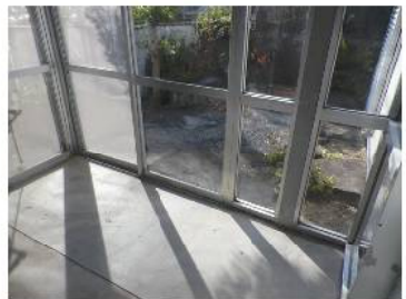
日当良好のテラス